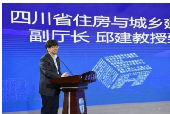
四川省住房与城乡建设厅副厅长邱建

中国工程院院士、教育部高等学校建筑学专业教学指导分委员会主任委员王建国院士作2019年度分委会工作报告。