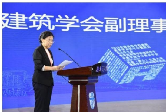
中国建筑学会副理事长赵琦