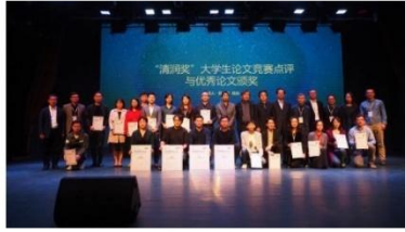
“清润奖”获奖同学、院校代表及颁奖嘉宾合影