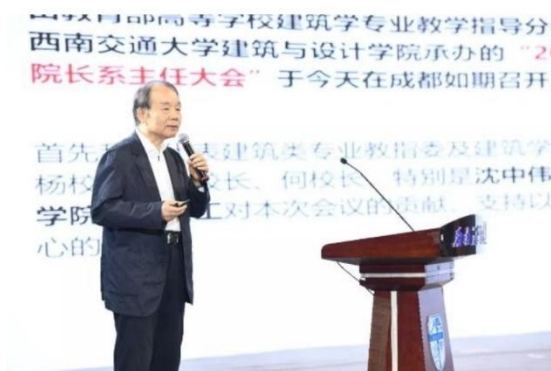
中国工程院院士王建国

中国工程院院士、教育部高等学校建筑学专业教学指导分委员会主任委员王建国院士作2019年度分委会工作报告。