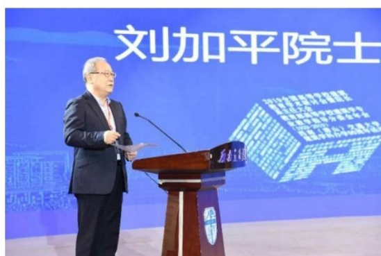
中国工程院院士刘加平